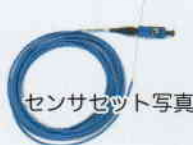
センサセット写真

センサ先端にある空洞の距離が外圧により変化することによって、本体から出力された光の反射光成分が変化します。それらで得た変化を圧力に換算します。